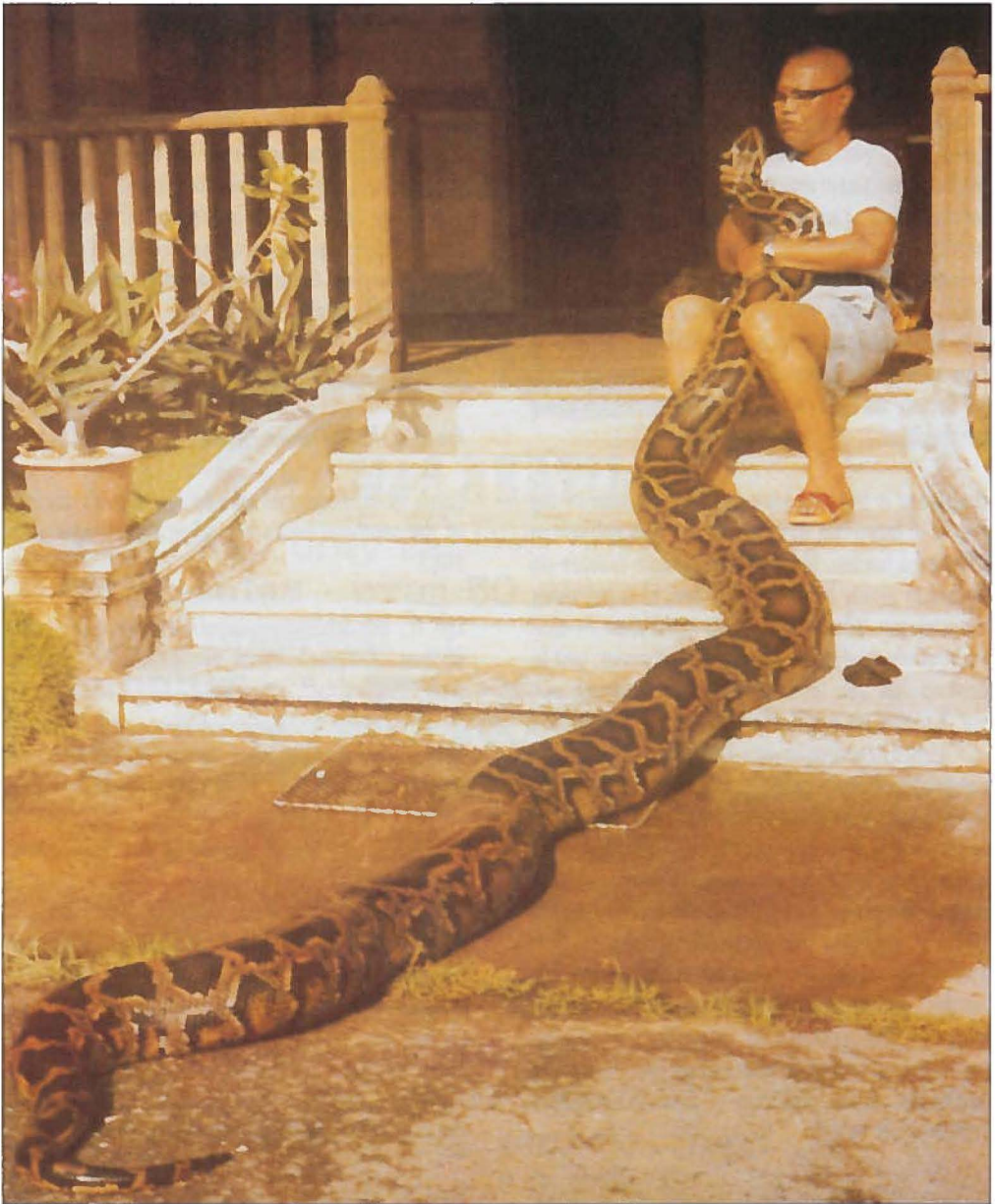
Een Python molurus bivittatus als huisdier van een zakenman in Bangkok. Uit: Engelmann en Obst, Mit gespaltener Zunge (Leipzig, 1981), pag. 194